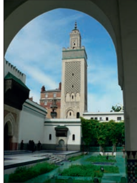
Mosquée de Paris