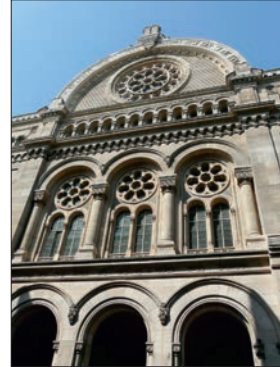
Grande Synagogue, Paris