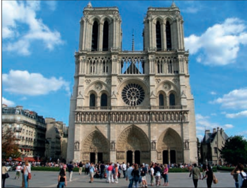
Notre Dame de Paris

Observe ces trois photographies. De quel genre de bâtiments s'agit-il ?